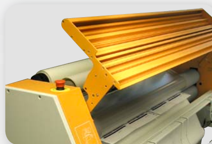
Einfacher Walzenzugang durch schwenkbaren Zuführtisch