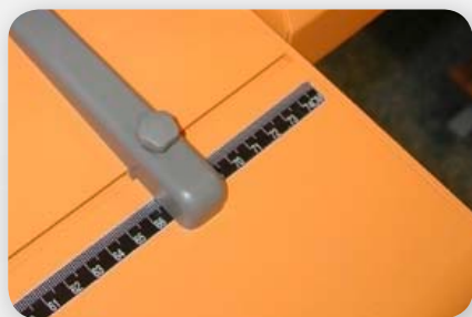
Anschlag skaliert auf dem Zuführtisch