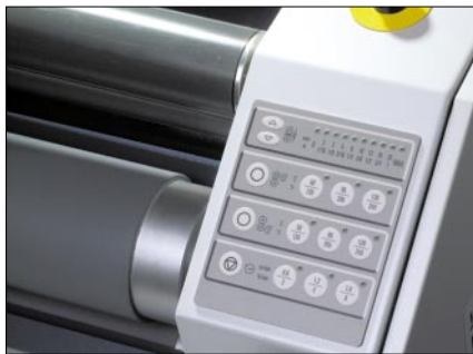
Berührungsfeld-Steuerpult mit vorprogrammierten Einstellungen für Temperatur, Geschwindigkeit und Materialstärke.